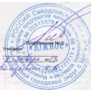
ГРАФИК ПЛАНИРУЕМЫХ РАБОТ ПО СОДЕРЖАНИЮ И РЕМОНТУ ОБЩЕГО ИМУЩЕСТВА