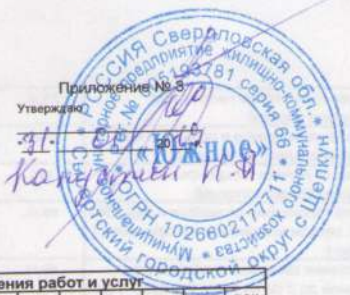
ГРАФИК ПЛАНИРУЕМЫХ РАБОТ ПО СОДЕРЖАНИЮ И РЕМОНТУ ОБЩЕГО ИМУЩЕСТВА 01.01.2019 - 31.12.2019 (период)